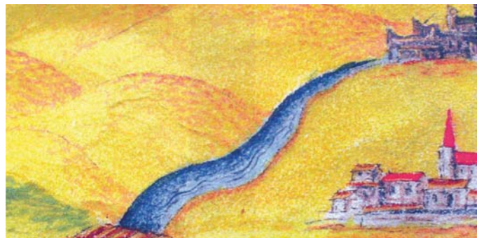
Zeichnung Altburg Schwanberg 1577