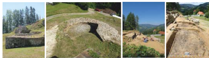
Ausgrabungsarbeiten Altburg Schwanberg 2012