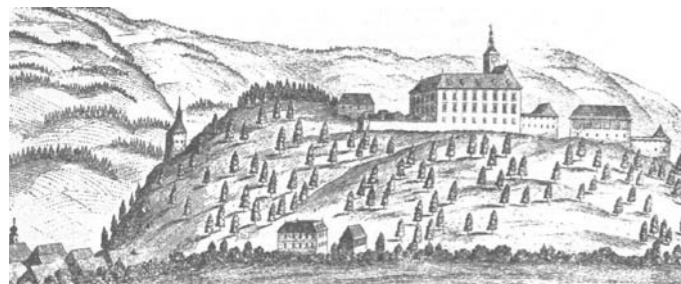
Stich Altburg Schwanberg 1680

Der sogenannte Tanzboden (das Gelände der Altburg mit dem Plateau) befindet sich nur 100 m vom Schloss Schwanberg entfernt, 150 m über dem Marktplatz. Im Jahre 2004 wurde die Burg dort wieder entdeckt, eine mächtige von Mauern geschützte Anlage, die den Ort lange Zeit beherrschte.